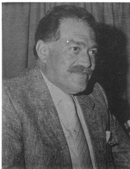
Diputado Angel Zambrano